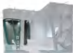
特装展位示例 (不含搭建费)