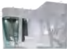
特装展位示例 (不含搭建费)